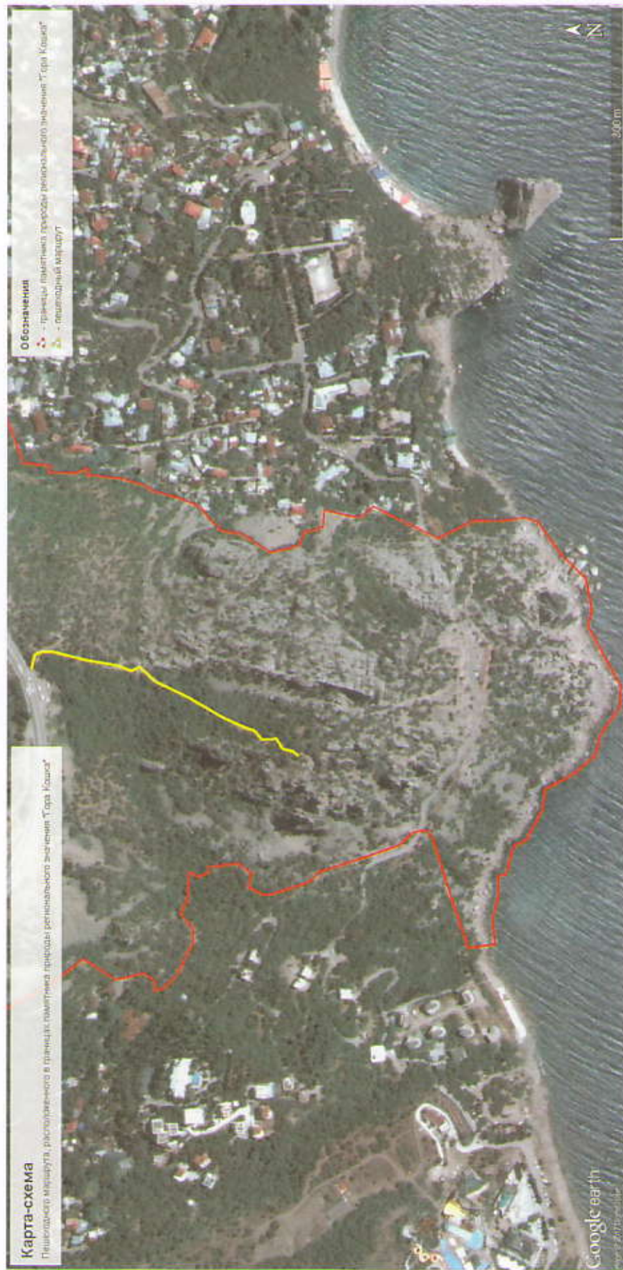
Карта-схема пешеходного маршрута, расположенного в границах памятника природы «Гора Кошка»