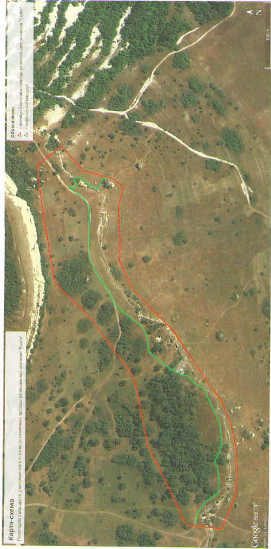
Карта-схема пешеходного маршрута, расположенного в границах памятника природы «Бакла»